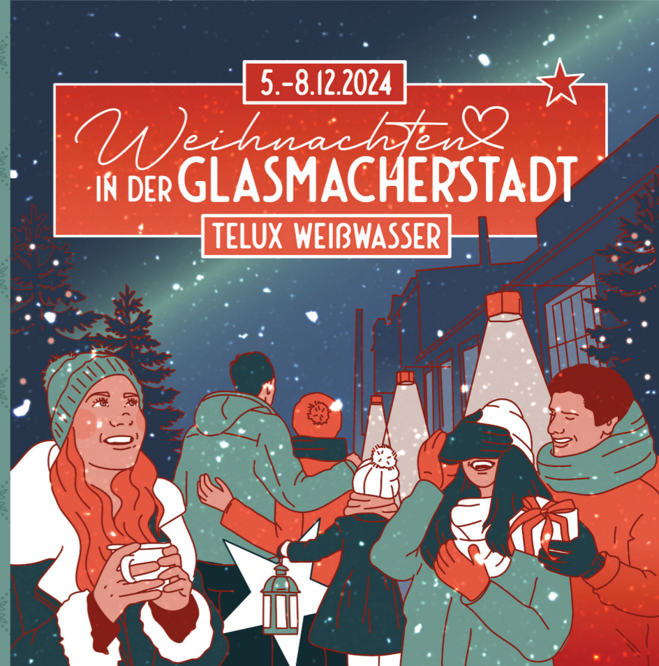
Illustration: Anne Proisie

Öffnungszeiten Donnerstag 15 - 21 Uhr Freitag & Samstag 14 - 22 Uhr Sonntag 14 - 21 Uhr