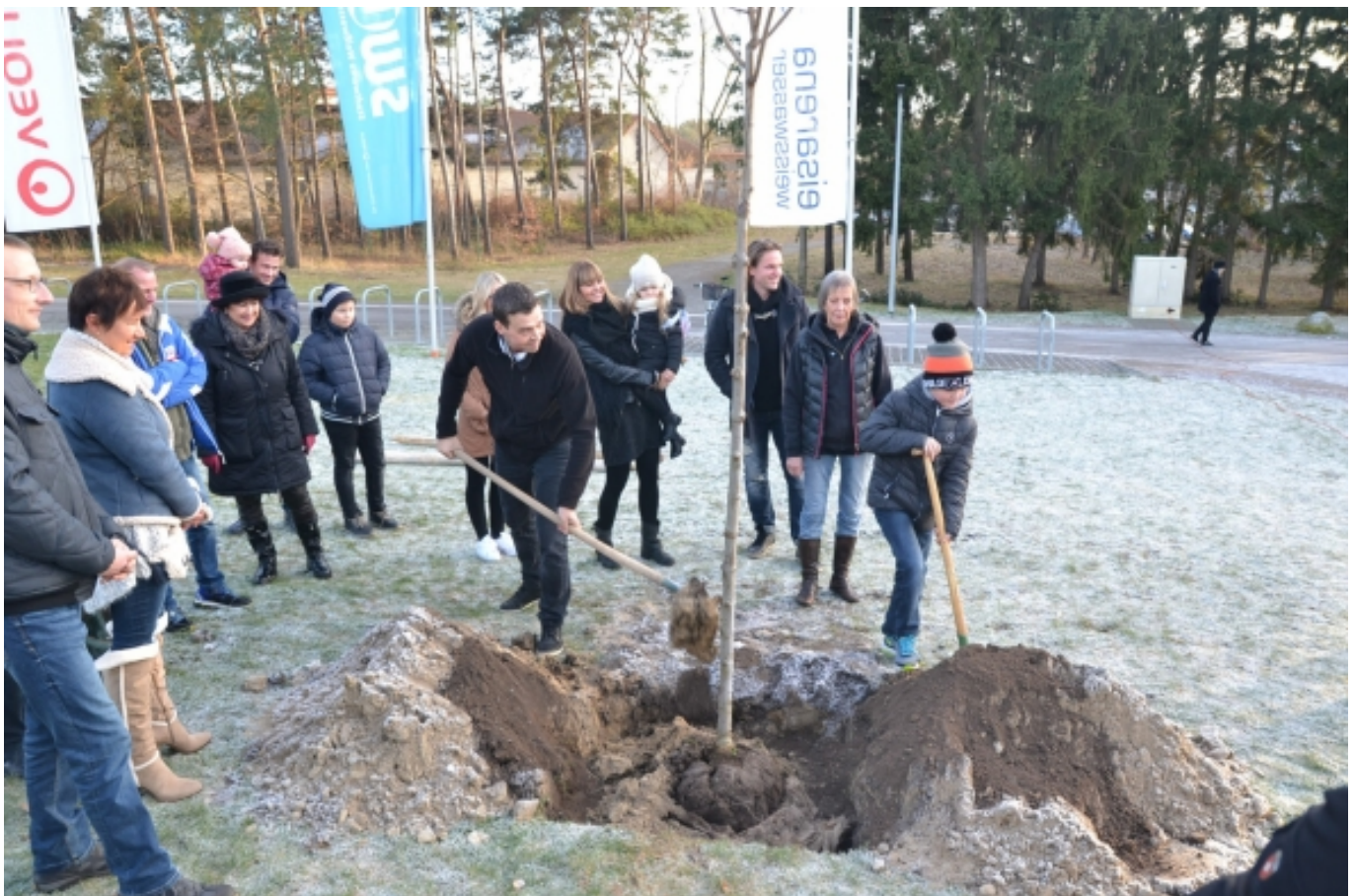
Pflanzaktion am 3.12.2016 vor der EISARENA