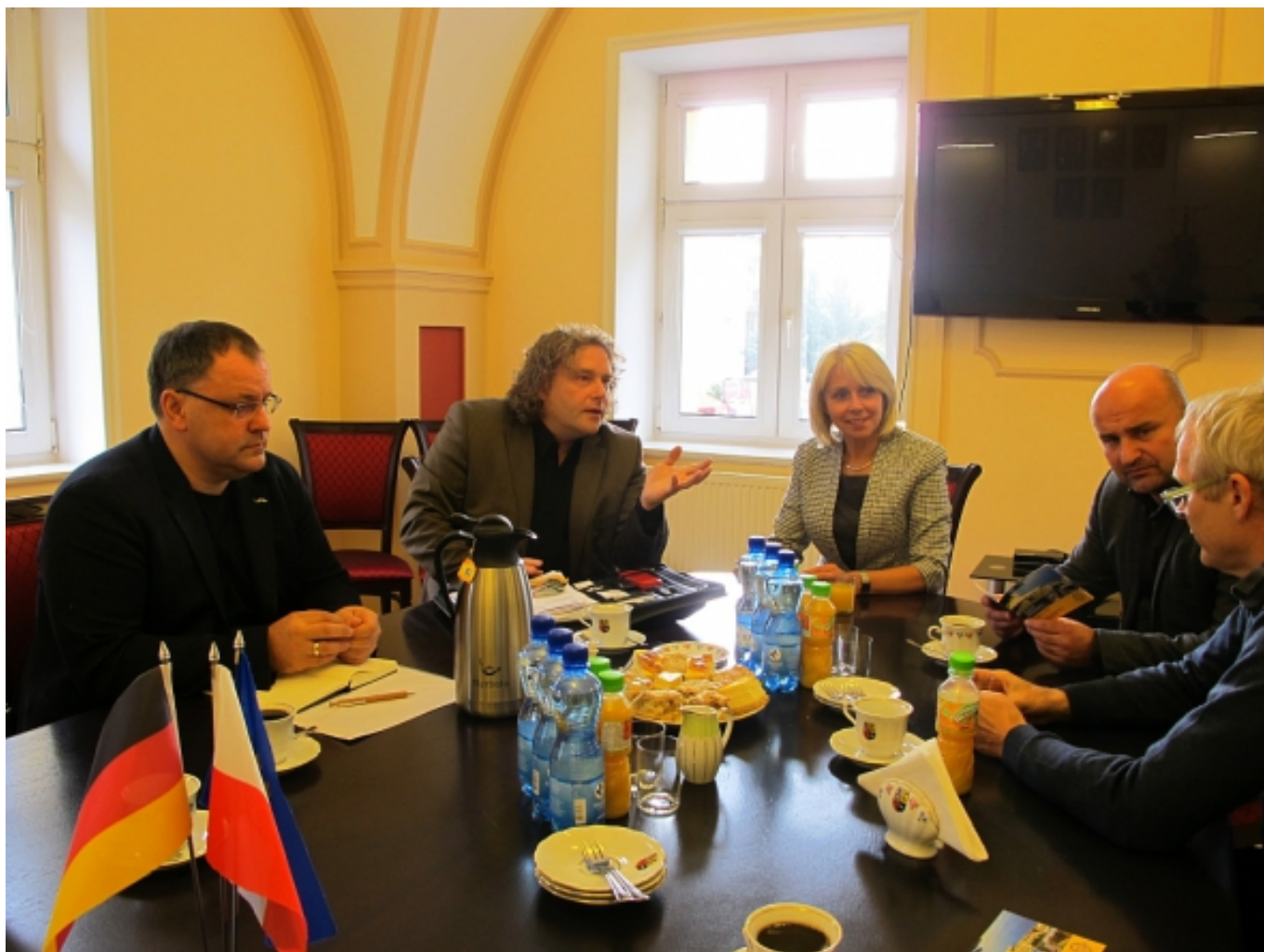
Austausch im Rathaus