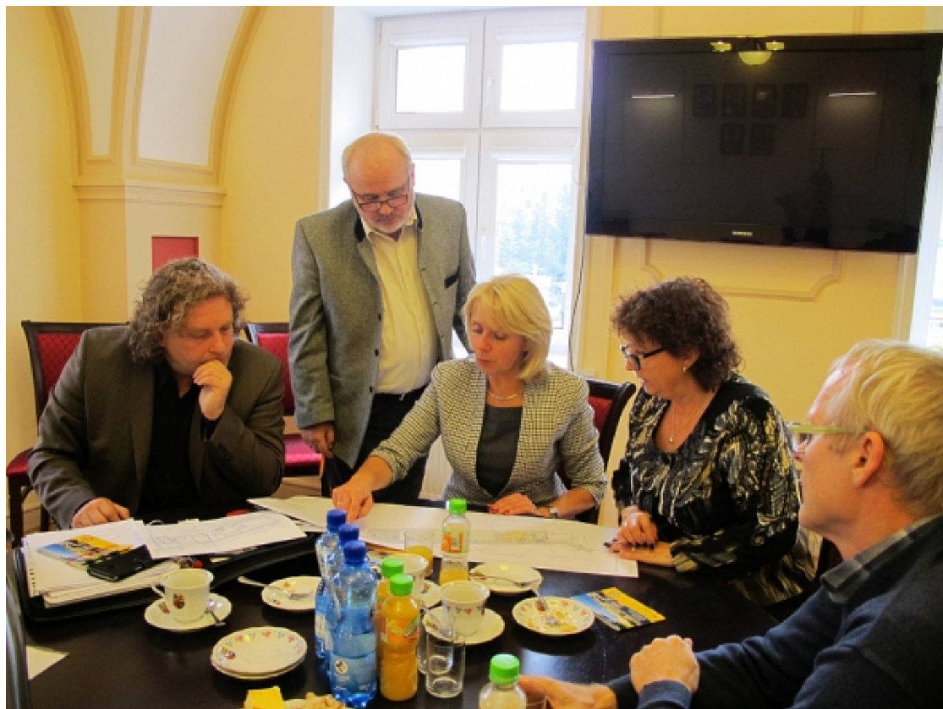
Austausch im Rathaus