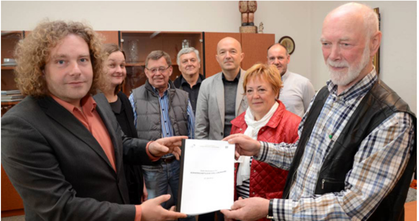
Die Übergabe der Bürgerschaftlichen Stellungnahme an die Stadtverwaltung