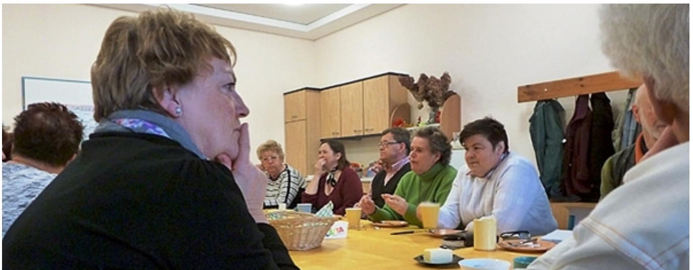
Teilnahme am Quasselfrühstück des SpiNNetz e.V.