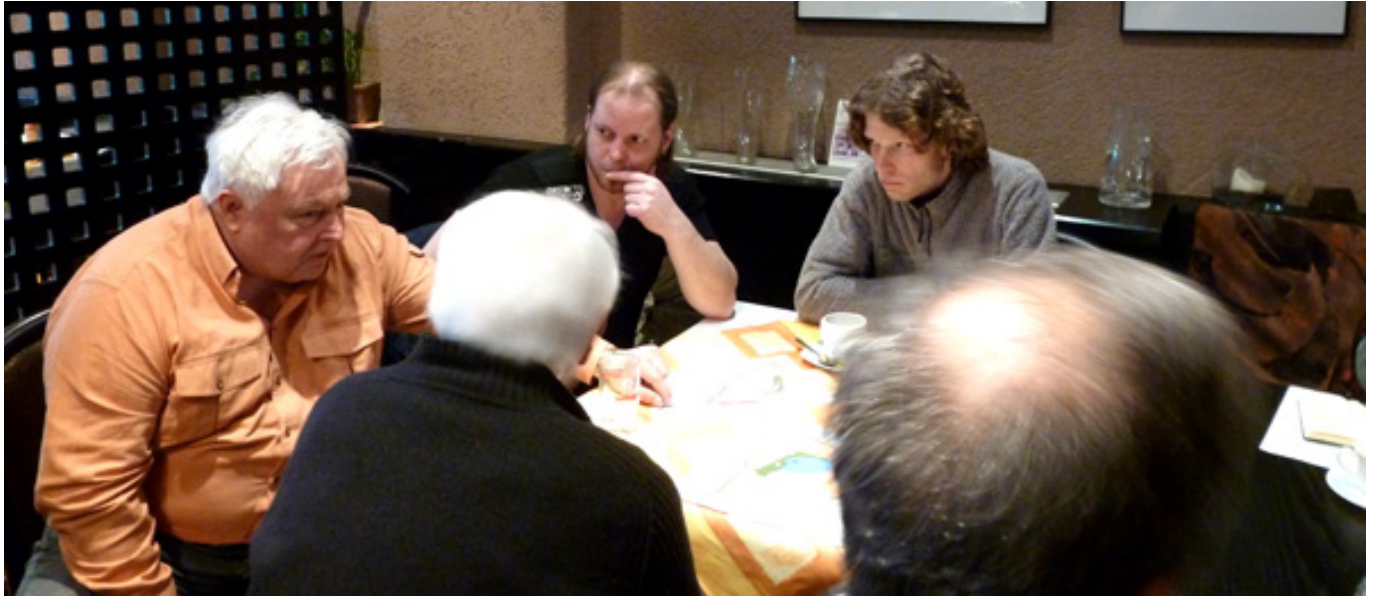
Treffen mit Anwohnern des Plangebiets in Prenzels Hotel

Die frühzeitige Einbindung der Anwohner sowie anderer Planungsbetroffenen sollte Gelegenheit geben, sich über die verändernde Situation auszutauschen und über das neue Beteiligungskonzept zu informieren und sich gegebenenfalls an den anschließenden Bürgerbeteiligungswochen zu beteiligen.