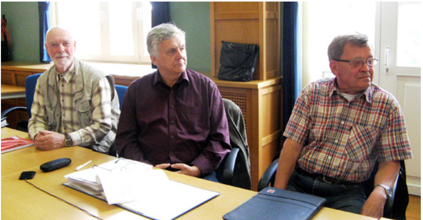
Die Gebietskundigen im Bau- und Wirtschaftsausschuss im Mai 2012