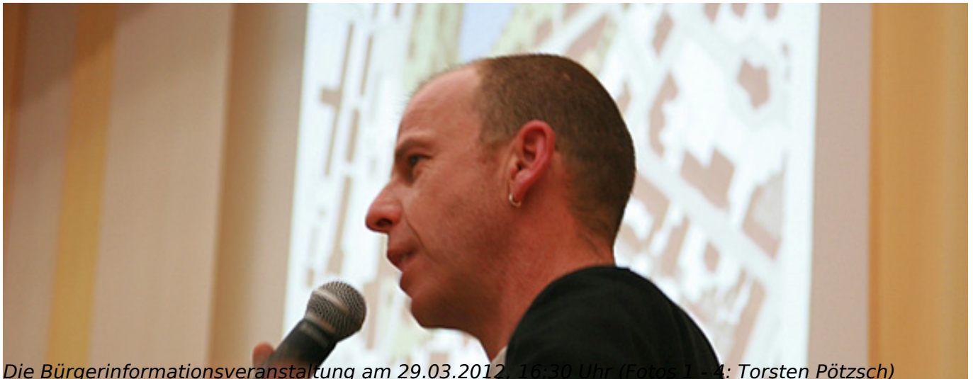
Die Bürgerinformationsveranstaltung am 29.03.2012, 16:30 Uhr