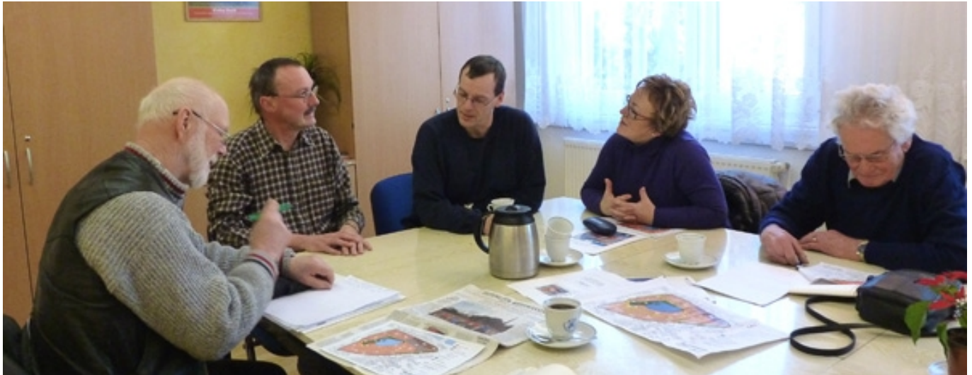
Treffen bei der Freiwilligen Feuerwehr Weißwasser