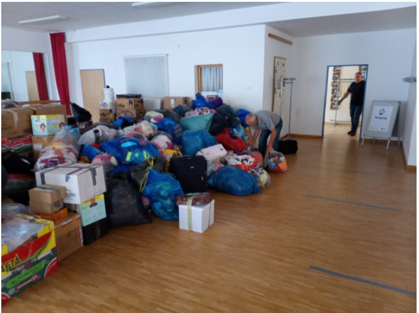
Hochwertige Sachspenden