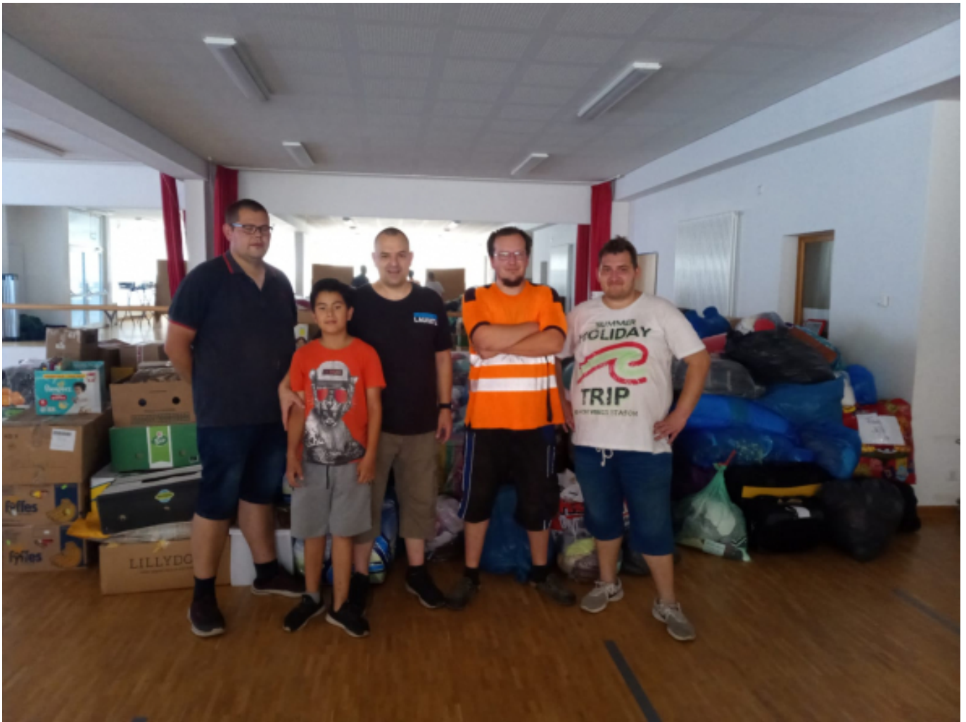
Hilfe aus Brandenburg.