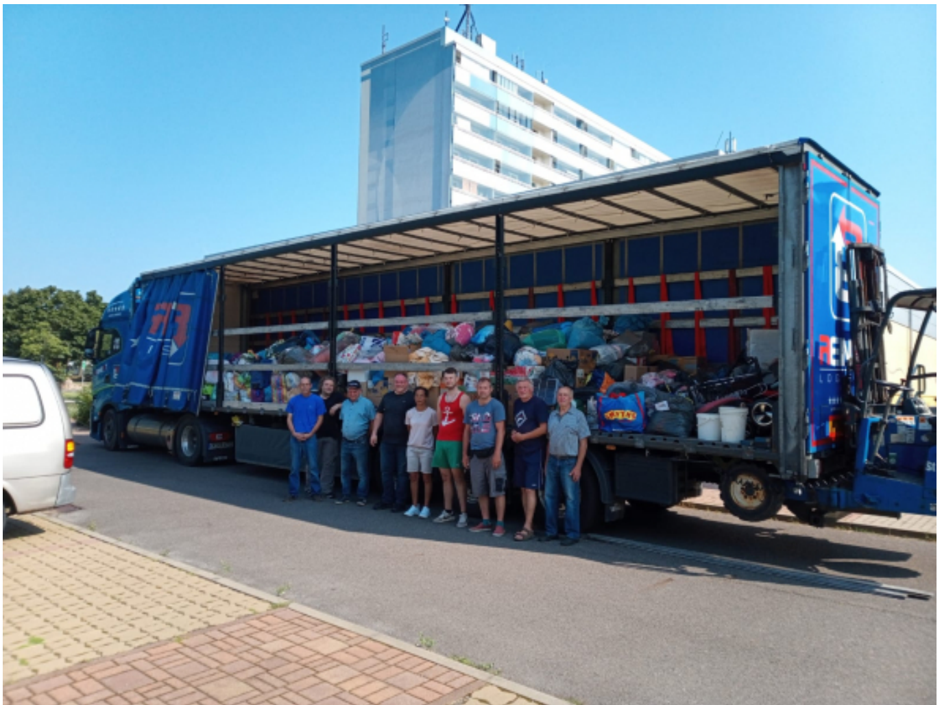
Die fleißigen Helfer (fast alle auf den Foto)