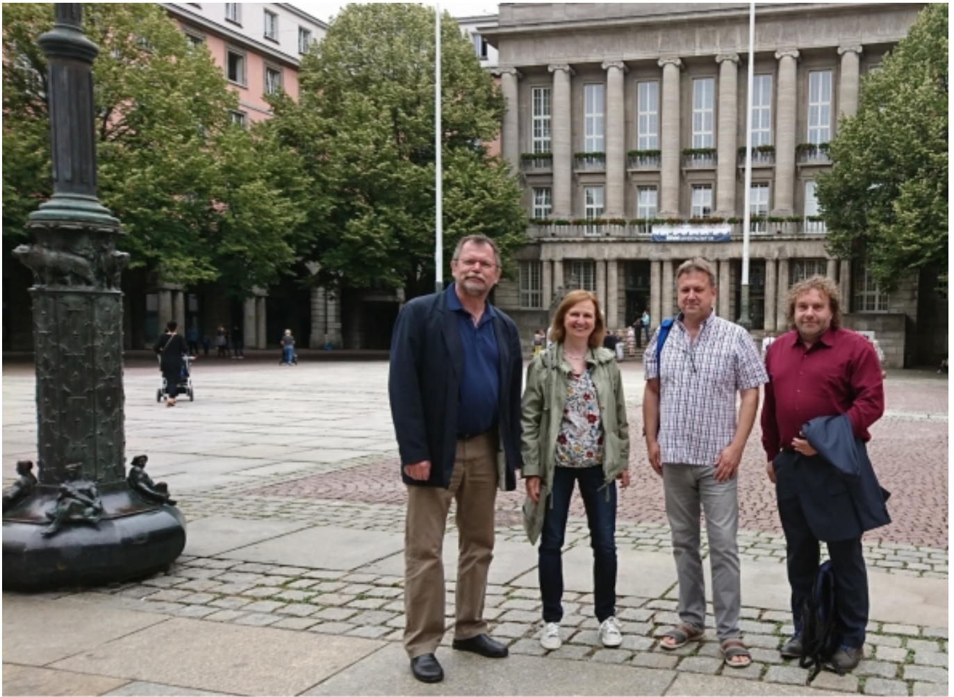
vor dem Wuppertaler Rathaus