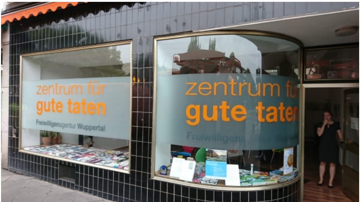
Freiwilligenagentur "Zentrum für gute Taten"