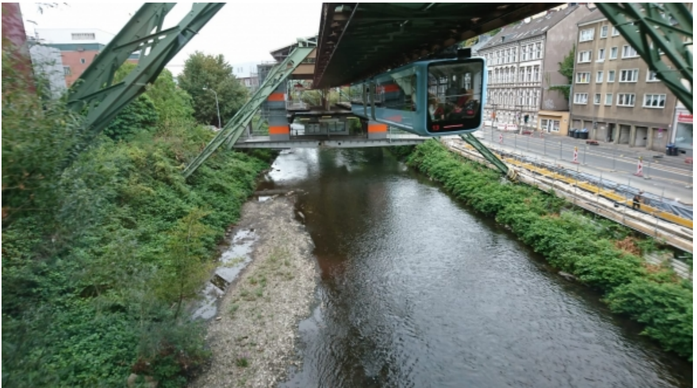
Die Wuppertaler Schwebbahn ist für den ÖPNV in der Stadt das wichtigste Nahverkehrsmittel.