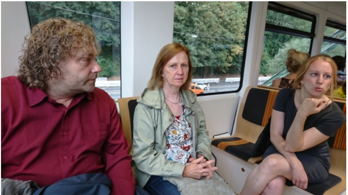
Erläuterungen zur Stadtentwicklung in der Wuppertaler Schwebbahn