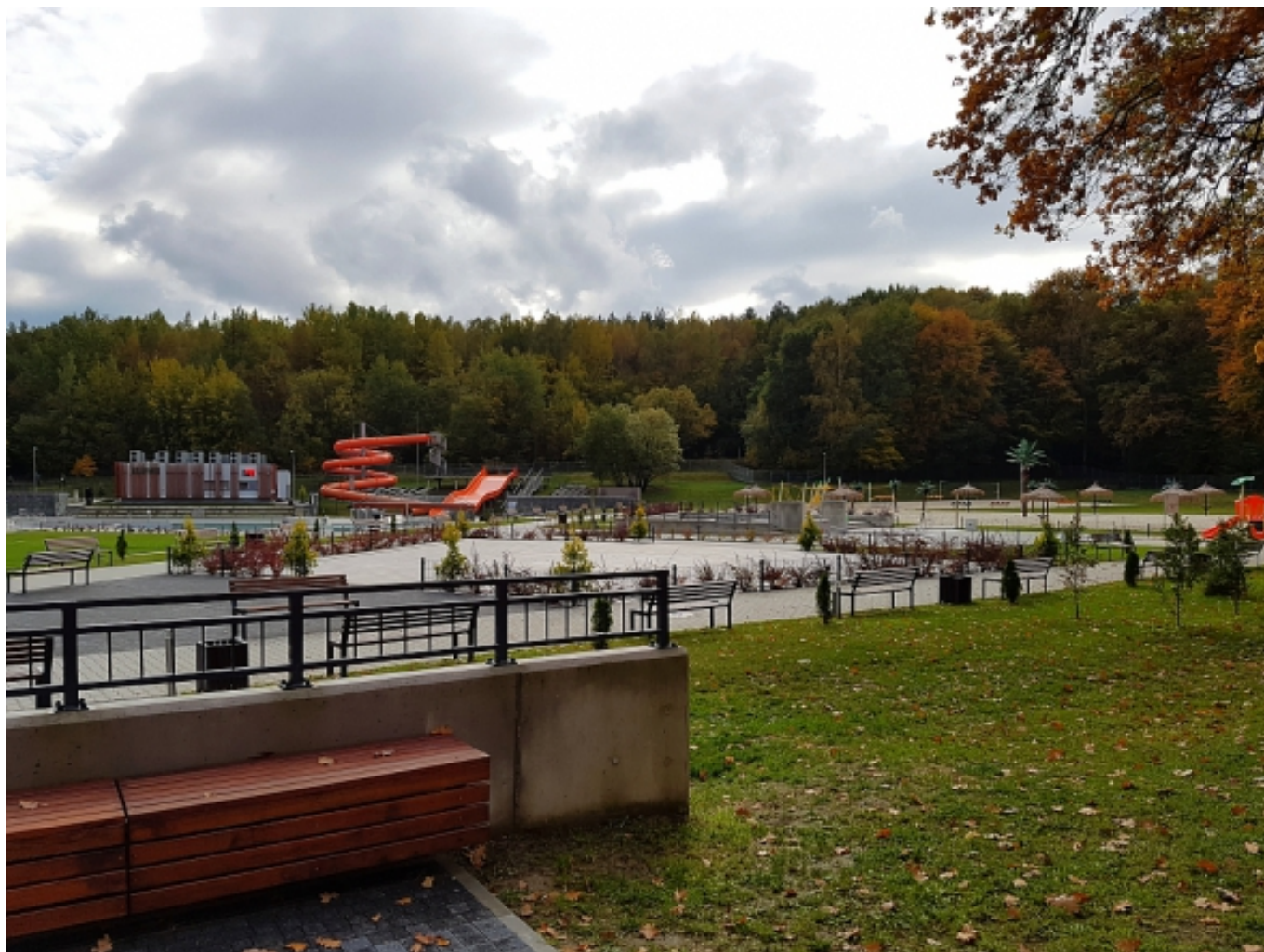
Das neu sanierte Schwimmbad, welches dieses Jahr eröffnet wurde