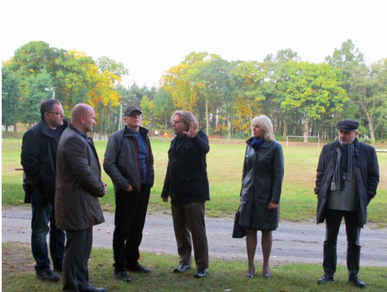
Vorort auf dem Sportplatz