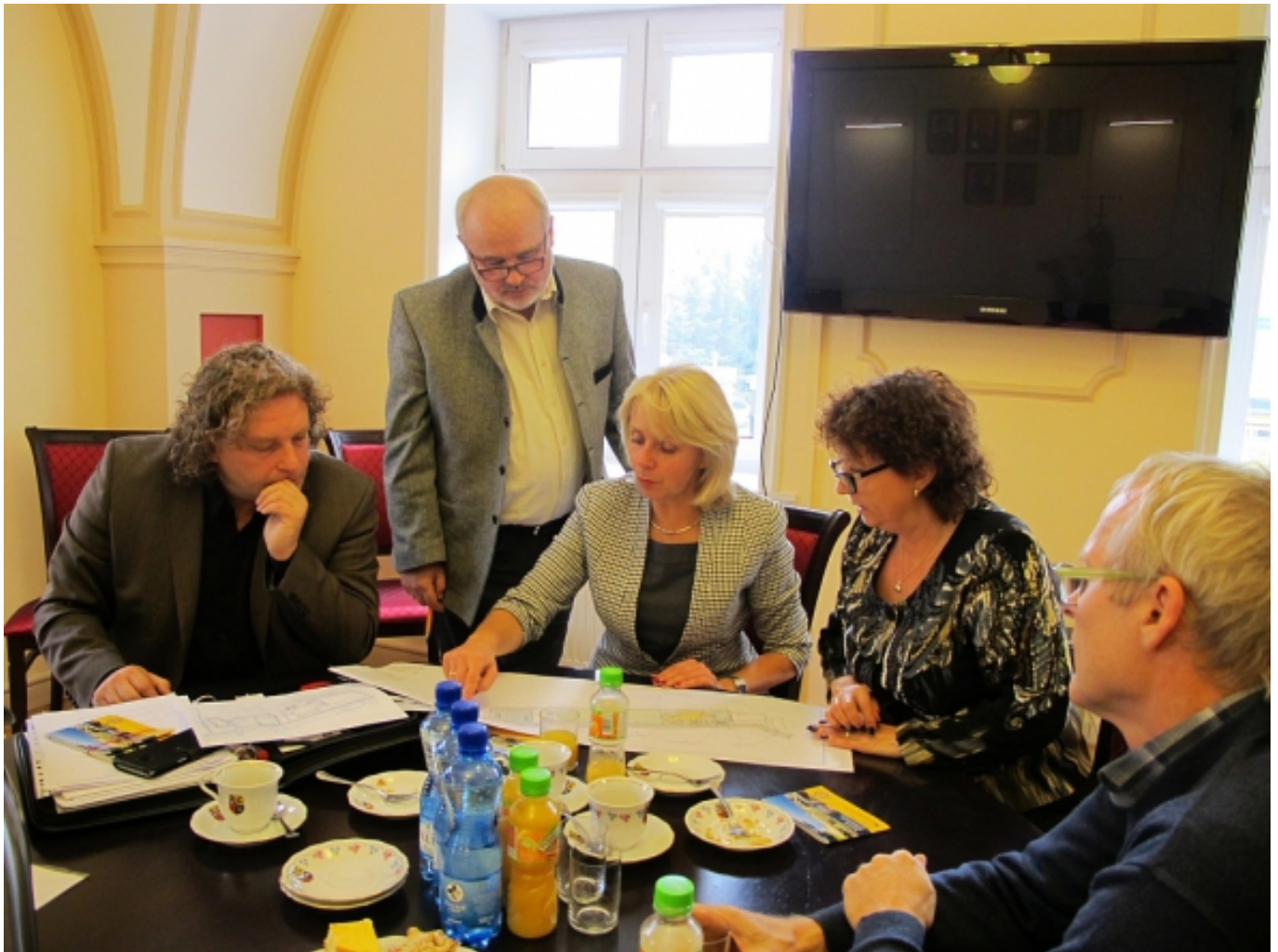
Austausch im Rathaus