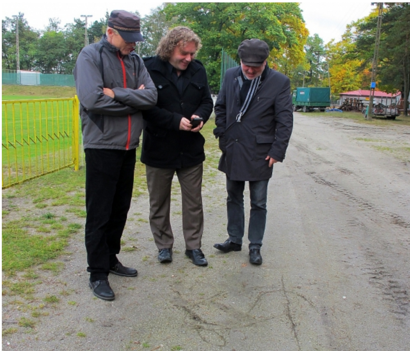
Neue Ideen in den Sand geschrieben und festgehalten