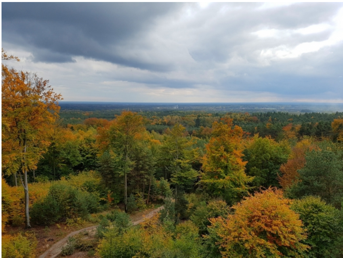
Blick auf den Sorauer Wald