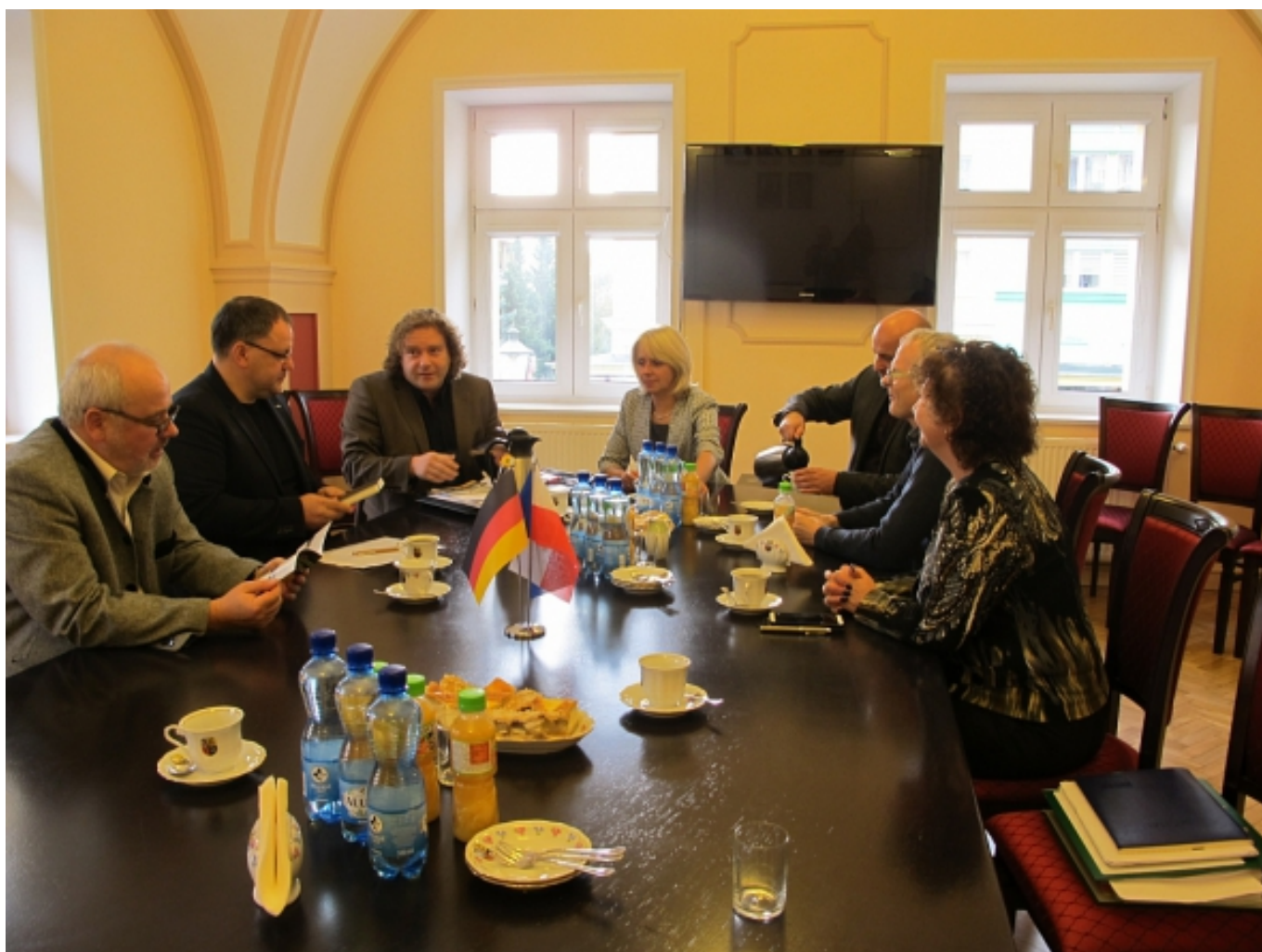
Austausch im Rathaus

Auf einer Rundfahrt wurden die aktuellen Baugeschehen am Sportstadion gezeigt, das neu sanierte Freibad besichtigt und der Aussichtsturm im Sorauer Wald bestiegen.