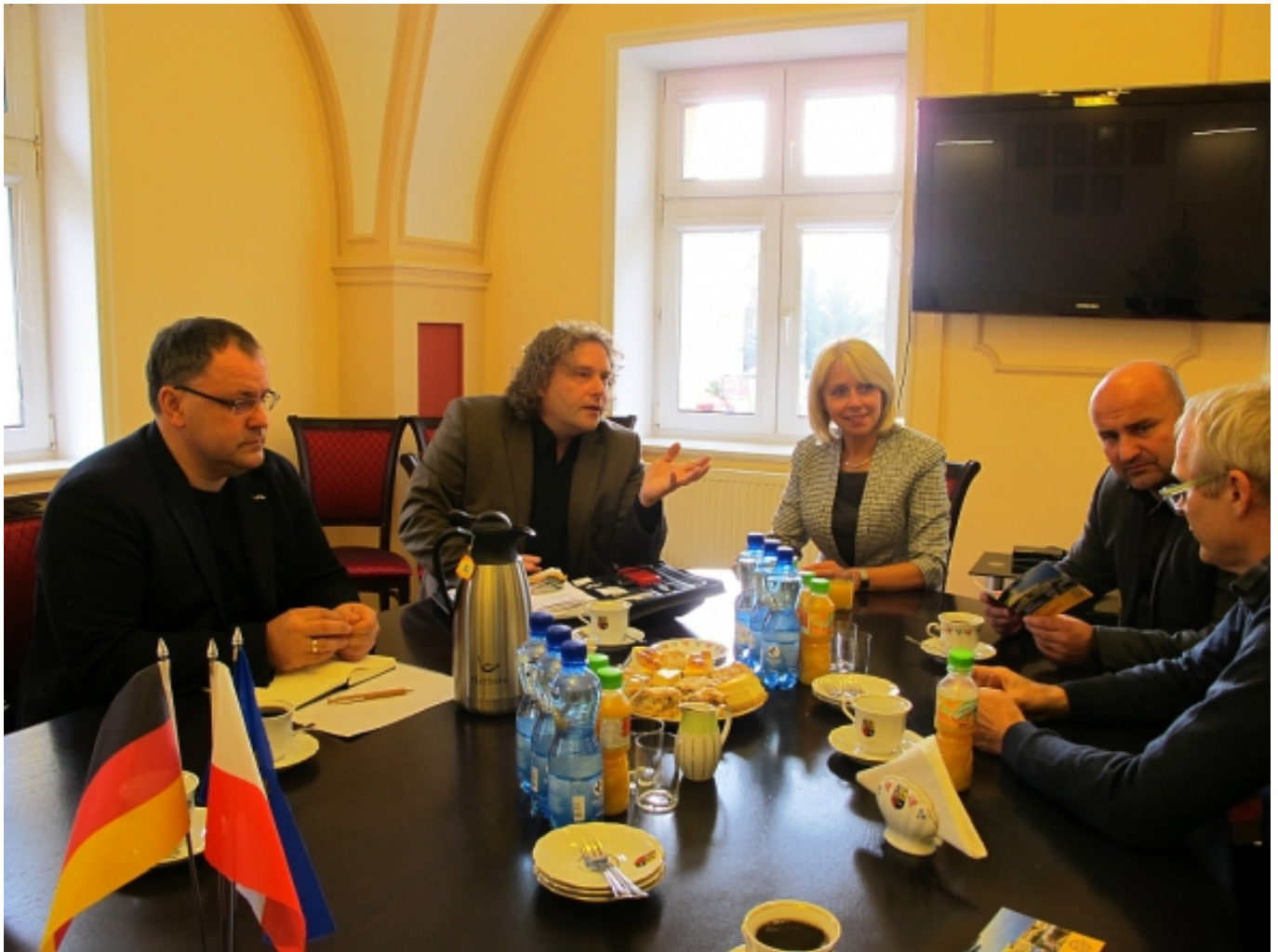
Austausch im Rathaus