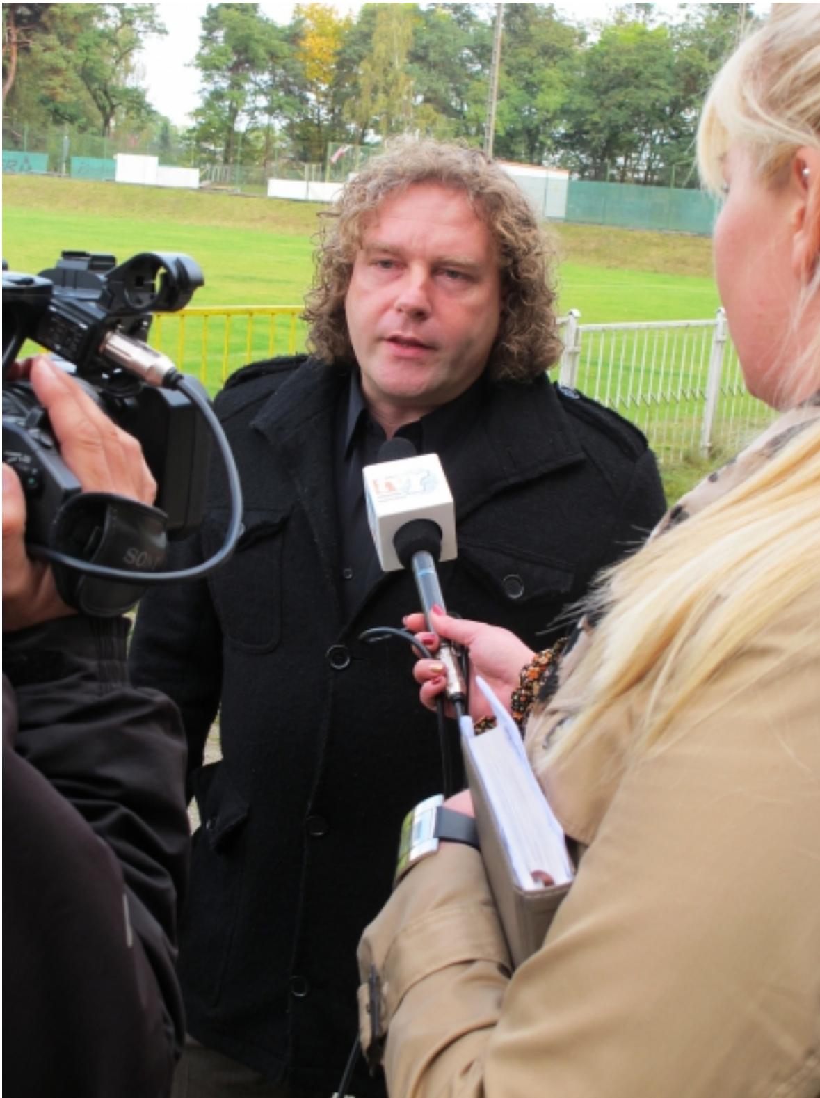
Das Regionalfernsehen mit vor Ort