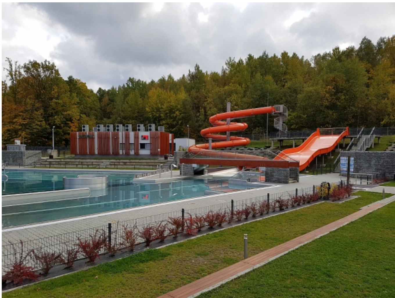
Das neu sanierte Schwimmbad, welches dieses Jahr eröffnet wurde